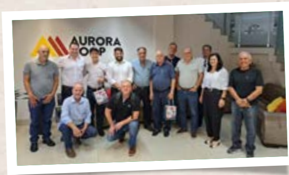
Visita à Aurora Coop em Chapecó

A visita à empresa Lac Lélo de São João do Oeste teve como objetivo conhecer o sistema de produção de produtos lácteos de grande valor agregado, suas estratégias de marketing para este segmento e seu sistema de parceria com os produtores selecionados e treinados para produzir leite de alta qualidade. A roteirização e estratégias de otimização de transporte do leite e a assistência técnica foram enfatizados nessa visita.