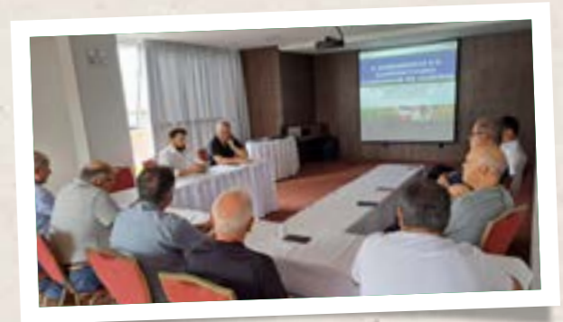
Palestra de apresentação do agronegócio e cooperativismo de Santa Catarina

Além das visitas, a CooperRita também participou da palestra sobre o agronegócio e o cooperativismo de Santa Catarina com o objetivo de familiarizar os membros da comitiva com as principais atividades agropecuárias do estado, bem como, apresentar o cooperativismo catarinense em números.