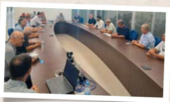
Reunião com a diretoria da Cooperativa Alfa em Chapecó