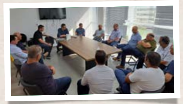
Reunião na sede da empresa de laticínios Lac Lélo em São João do Oeste