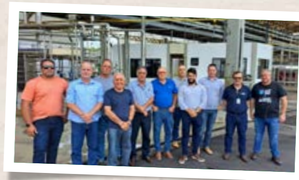
Visita à indústria de laticínios da Aurora em Pinhalzinho