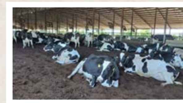
Visita ao Compost Barn da família Grasel de São João do Oeste