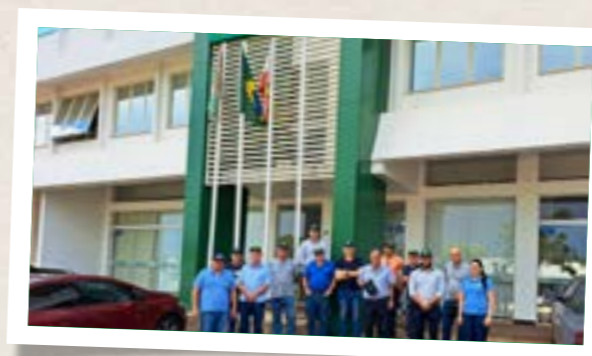
Visita à Cooperativa Itaipu em Pinhalzinho