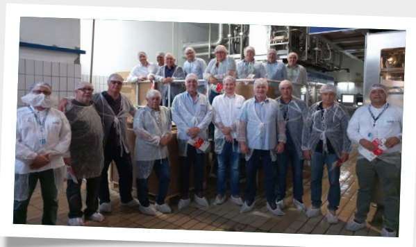
Visita do conselho

O cateter chegava a 88% de eficiência máxima, uma perda de quase 1,5%. Então, isso também é uma relação de ganho muito grande para a CooperRita.